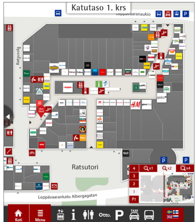
Lageplan mit Informationen zu den Geschäften